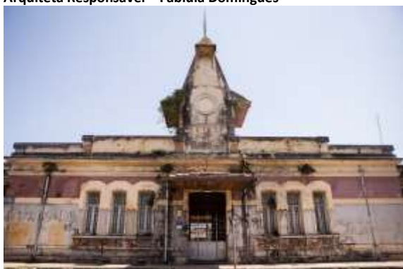
Restauro da Estação Ferroviária da Taubaté, Taubaté – SP (em andamento)