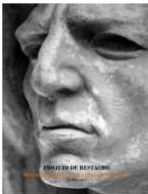
Projeto de Restauro