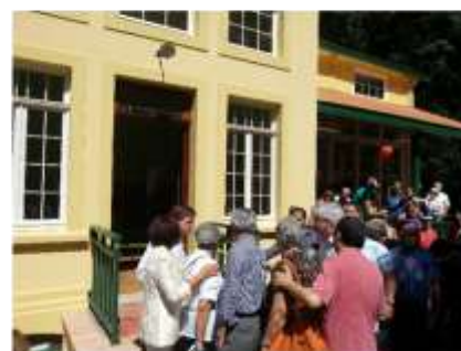
Inauguração - Janeiro 2013

Convento Nossa Senhora do Amparo – São Sebastião – 2012