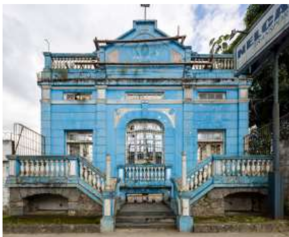
Antiga Sede da Associação de Socorros Mútuos, Cubatão, SP – 2022.