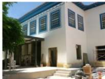
Inauguração – Março 2014