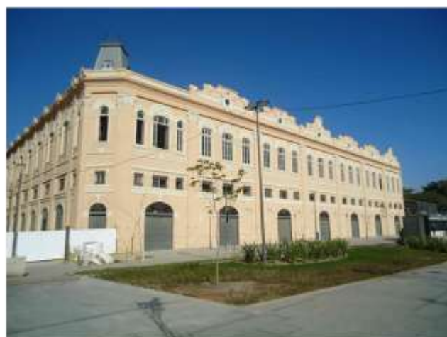
Inauguração – Julho 2016