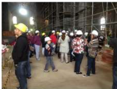
Educação Patrimonial – Visitas guiadas