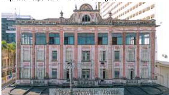
Antigo Hotel Palace, Santos - SP (em andamento).